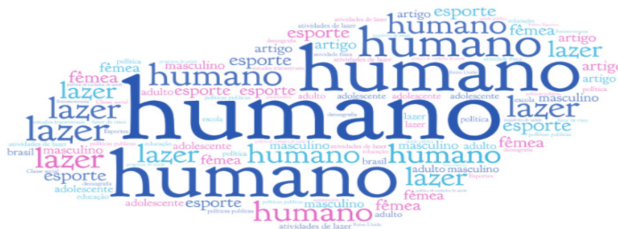
Figura 1. Nuvem de Tags

A partir da análise bibliométrica, com base no grupo de trabalhos recuperados na base de dados Scopus , foi possível identificar um total de 168 palavras-chave diferentes. O destaque ficou com a palavra-chave Humano com 9 ocorrência, seguidas de Lazer e Esporte com 8 ocorrência, Fêmea com 7, Masculino com 7, Adolescente, Artigo, Humanos, Atividades de lazer, Políticas públicas com 6 ocorrência cada um seguidas de Adulto e política com 5 ocorrência cada um. Com 4 ocorrência foram: Demografia, Educação, Política de cuidados de saúde. Com três foram: envelhecimento, Brasil, Estudos Transversais, Estudo transversal, Programa de Saúde, Inquérito de Saúde, Atividade física, Saúde pública, Questionário, Lazer, Fator de risco, Escola, Classe social, Socioeconômica, Política Esportiva, Esportes e Reino Unido. As palavras que apareceram com 2 ou 1 ocorrência não foram usadas na pesquisa. Essas são as palavras destaques entre outros que apareceram como palavras nesse cenário de publicação. Conforme a imagem e a seguir.