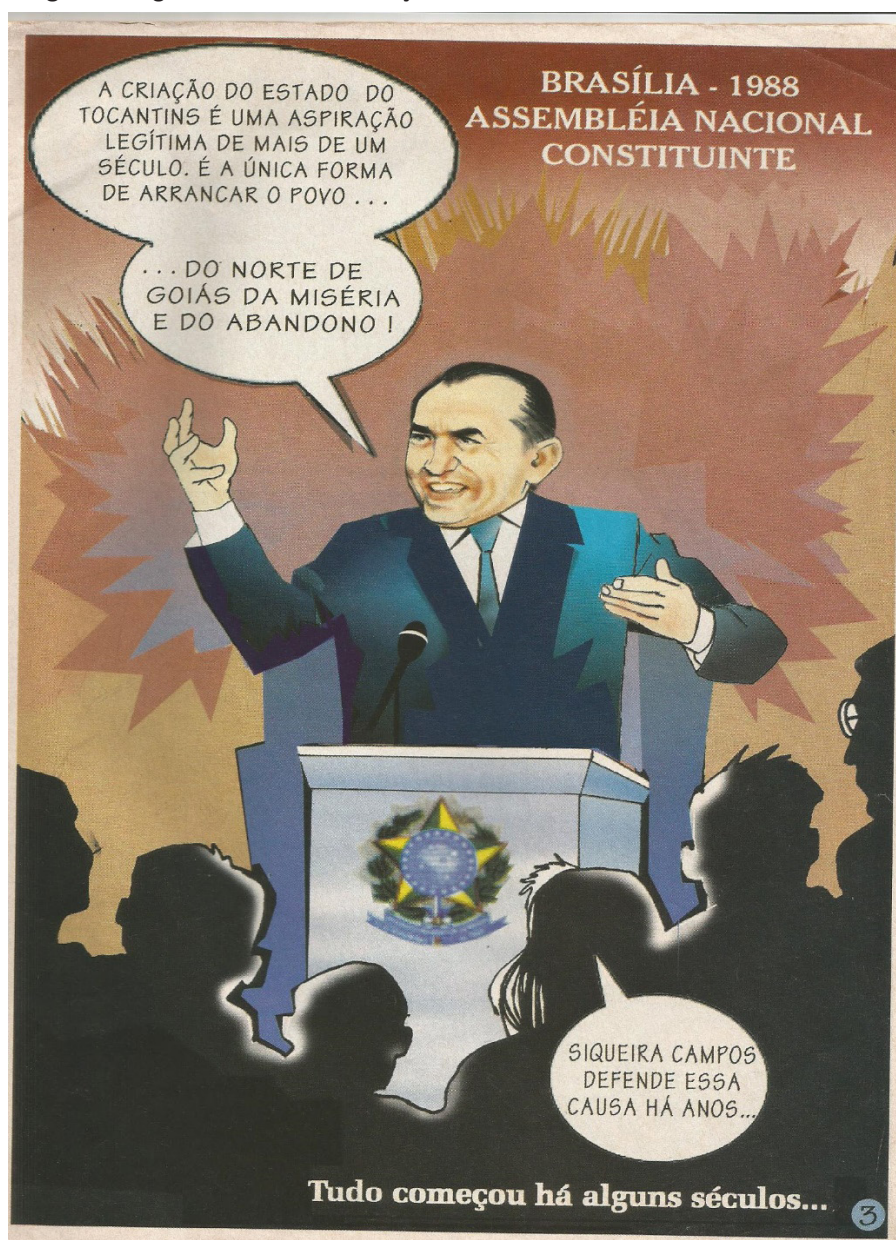
Imagem 2. Página da HQ sobre a criação do Tocantins.