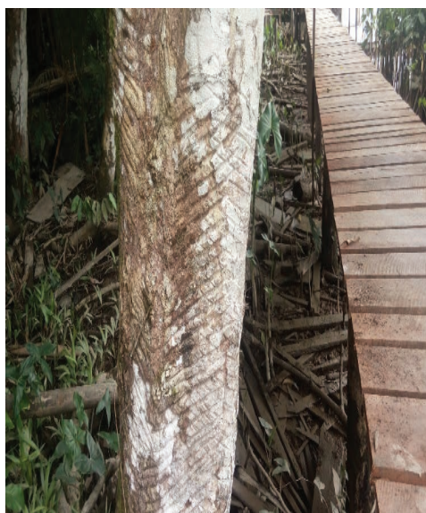
Figura 2. Árvore de seringueira e as marcas dos cortes realizados na retirada do látex.

Não podemos deixar de notar nesse cenário a exploração dos recursos naturais impulsionado pelos ciclos econômicos, que causaram (e continuam a causar) prejuízos profundos à natureza. Na comunidade Santo Antônio, destacam-se as marcas do ciclo da borracha, fins do século XIX até 1912, evidenciadas nas seringueiras que encontramos na comunidade (Figura 2), bem como nas memórias de moradores, que na época trabalharam na extração do látex com os pais. Além das memórias e das seringueiras, têm-se ainda artefatos achados na mata, a exemplo do recipiente (tigela) de barro usado na coleta do látex (Figura 3), conforme mencionou o entrevistado H24.