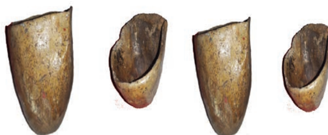
Figura 3. Artefato usado na coleta do látex. Vasilhas de barro.