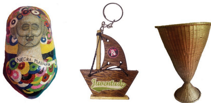
Figura 4. Artesanatos produzidos pelos moradores da comunidade Santo Antônio.

Além das marcas encontradas na comunidade e nas memórias dos moradores sobre deixar os estudos para trabalhar, observamos ainda a existência de vários artesanatos, o que revela um pouco de suas práticas e saberes tradicionalmente herdados. Percebemos que a matéria-prima utilizada na produção dos mesmos (Figura 4) são as mais diversas, como os pedaços de madeira (usados na confecção de pequenos chaveiros), tala de arumã (para confecção de peneiras), cascos de jabutis (estes são decorados com desenhos e pinturas) e sementes, como o mururu e o bole-bole, usados na confecção de chaveiros e outros. Tais artefatos são utilizados tanto na decoração das casas como para a comercialização. Cabe registrar que o entrevistado H24 viaja para várias cidades vendendo suas artes o que contribui para divulgar seus saberes e ampliar sua renda.