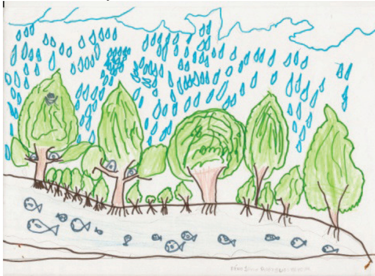
Figura 4 – Desenho da Criança 3