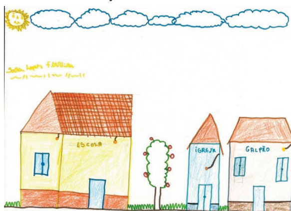
Figura 7 – Desenho da Criança 6

Por ser uma área em que a pecuária é dominante, como foi o caso da fazenda desapropriada para os posseiros, são poucas as áreas de florestas na comunidade assentada, embora a região apresente inúmeras florestas plantadas e aptidão para a exploração deste tipo de matéria-prima. A questão ambiental também foi bastante retratada durante a etapa de intervenção pelos pesquisadores extensionistas durante a etapa de elaboração do documento do PDA, seja na escola com as crianças ou mesmo em casa pelas famílias. Isto é, o assunto meio ambiente se fez tão presente no decorrer da construção do PDA, tendo em vista as discussões em torno das áreas de preservação permanente e reserva legal, importantes na definição territorial do assentamento.