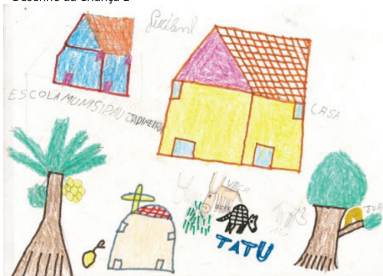
Figura 2 – Desenho da Criança 1