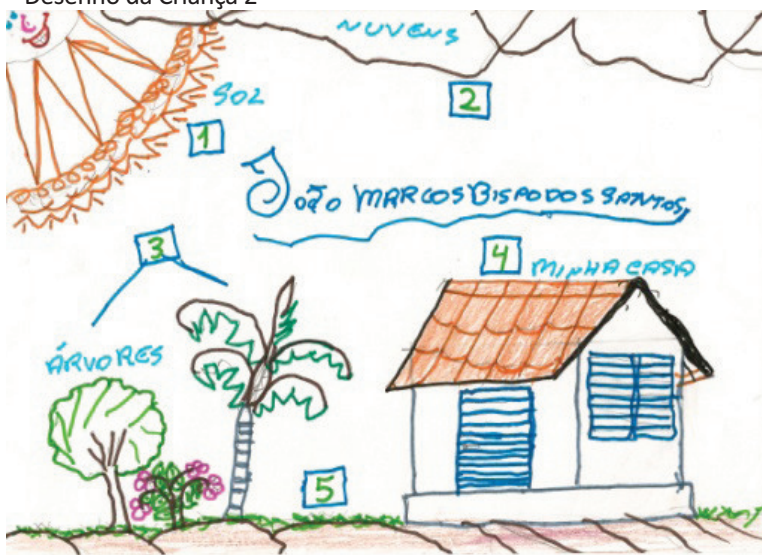
Figura 3 – Desenho da Criança 2

Na Figura 2, a criança representa o PA Jardineira através de sua casa, da igreja e da escola. Todas as construções remetem as instituições que ela traduz como importante na representação do assentamento. Por serem espaços que possivelmente fazem parte diretamente do cotidiano das crianças, percebeu-se também em outros desenhos que a maioria das crianças não relaciona o assentamento apenas com a conquista do seu “pedaço de terra”, mas também com a criação de igrejas e da própria escola na área assentada, o que contribui na percepção desta sobre a organização social do local em que vivem. Além disso, podemos notar a presença de alguns animais e de árvores frutíferas como parte deste espaço, enfatizando uma preocupação com o meio ambiente e com a organização produtiva do assentamento. Chama a atenção o fato dos seres humanos não aparecerem como parte de sua ilustração.