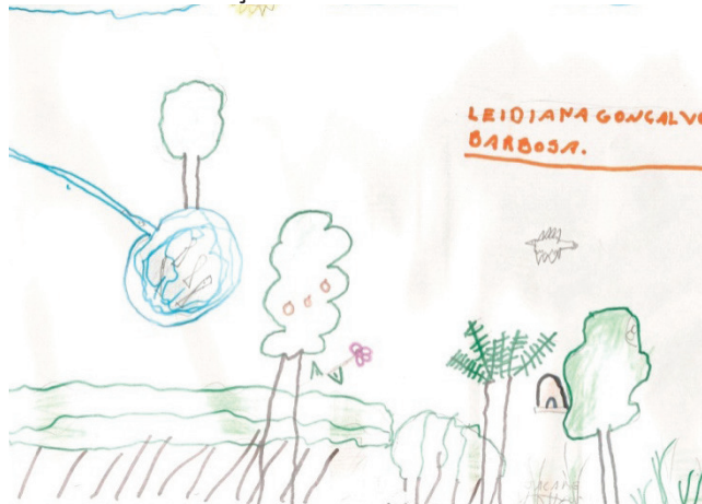
Figura 6 – Desenho da Criança 5

Neste caso, pode-se aferir que a família, a escola e o trabalho são organizações institucionalizadas e marcantes no assentamento rural, o que promove a ligação direta com o modo de vida individual e coletivo, refletido após a conquista da terra.