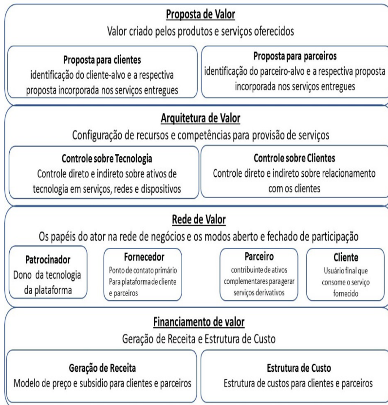
Figura 1. Framework de Modelo de Negócios para Plataformas.