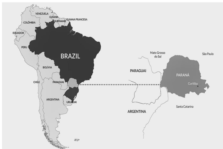
Figura 2. Curitiba no mapa do Brasil

O Tribunal de Justiça do Estado do Paraná, no qual a Comissão de Conflitos Fundiários possui sua sede, está localizado na cidade de Curitiba, no estado brasileiro do Paraná, conforme Figura 2.