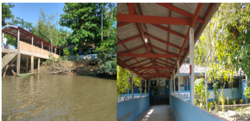
Figura 2. Escola Municipal de Educação Infantil, Ensino Fundamental e Médio Santa Maria

Inaugurada em 03 de agosto de 1996, a escola Santa Maria (Figura 2) possui um espaço que abrange 6 salas de aulas, 2 banheiros para os alunos, 1 banheiro para os funcionários, 1 cozinha, 1 secretaria (que funciona como sala de aula), 1 laboratório de informática (com apenas 1 computador funcionando), um pequeno pátio, ponte coberta, depósito de merenda escolar e almoxarifado, possui ao lado o projeto Salta Z (sistema de tratamento de água). Funciona nos períodos matutino e vespertino, é anexa da Escola Municipal Joaquim Mendes Contente (alunos do município) e da Escola Estadual Bem Vinda de Araújo Pontes (alunos do estado) ambas localizadas no município de Abaetetuba/PA. A escola possui 6 turmas do Município (Maternal a séries iniciais do Ensino Fundamental) e 7 turmas do Estado (séries finais do Ensino Fundamental e Ensino Médio). Além disso, a mesma não possui um regimento interno e nem um estatuto, é regida pelo Projeto Político Pedagógico e Conselho Escolar.