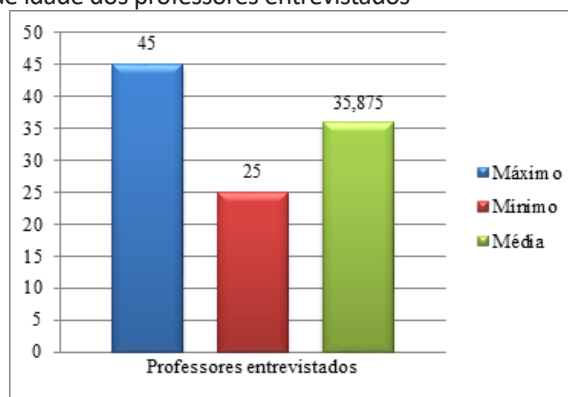
Gráfico 1. Média de idade dos professores entrevistados

Durante a pesquisa de campo com observação e aplicação de questionários semiestruturados, foram entrevistados 08 professores de Ciências/Biologia da escola Santa Maria que atuam na educação infantil, anos iniciais e finais do Ensino Fundamental e Ensino Médio, destes 70% são do sexo feminino e 10% do sexo masculino, que apresentam em média 35 anos (Gráfico 1).