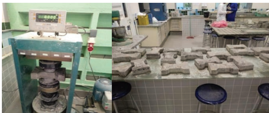
Figura 5. Peças de pisos intertravado de concreto após regularização das faces com argamassa e ensaio de resistência a compressão em prensa manual.

Para a característica mecânica, foi verificada a resistência à compressão das peças de pavimentos intertravados, com a análise de 5 peças para cada traço de concreto: T1, T2, T3, T4. Todos os corpos de prova foram capeados para a regularização da superfície com argamassa convencional (areia, cimento e água) (Figura 5a). Após o capeamento, aguardou-se 24 horas para o rompimento de forma a se permitir a determinação de sua resistência à compressão (Figura 5b). A característica física dos elementos intertravados de concreto foi verificada utilizando 5 peças de cada traço, de acordo com a NBR 9781:2013 para obtenção da absorção de água.