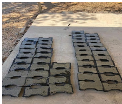
Figura 3. Peças produzidas na obra do Hospital do Amor em Palmas – TO.

A produção das peças de intertravados ocorreu no pátio da obra do Hospital do Amor de Palmas – TO, no mês de maio de 2019, em que todo o material utilizado foi levado do UniCatólica para obra. A produção seguiu as etapas de pesagem do material, mistura do mesmo na betoneira, adensamento do concreto nas formas pela mesa vibratória (Figura 3).