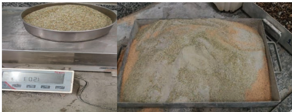
Figura 2. Vidro moído.

As garrafas coletadas foram limpas, e em seguida foram moídas por meio do moinho de martelos e o Abrasão Los Angeles, adotando-se a ABNT NM 51 (2001) como referência, adquirindo diferentes granulometrias. O material utilizado foi o passante da peneira 4 (#4,8 mm) (Figura 2).