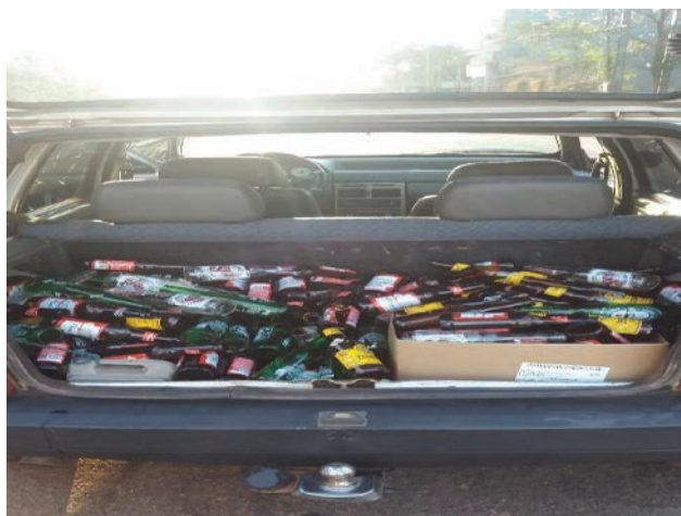
Figura 1. Garrafas coletadas.

Os materiais utilizados na pesquisa constituíram-se do cimento Ciplan CP-V-ARI, agregado miúdo areia do tipo média (lavada de rio) e agregado graúdo brita 0 (rocha britada), fornecidos pelo Centro Universitário Católica do Tocantins - UniCatólica. O vidro utilizado foi proveniente da coleta seletiva de garrafas do tipo long neck em bares e restaurantes da cidade de Palmas – TO, em agosto de 2018 (Figura 1).