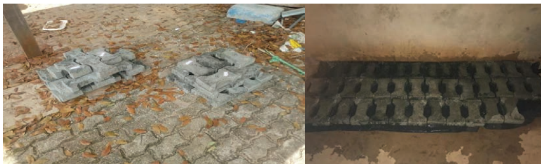
Figura 4. Peças no processo de cura ao ar livre à sombra e cura úmida por aspersão, respectivamente.