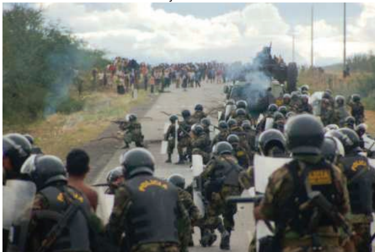
Figura 1. Massacre de Eldorado dos Carajás.