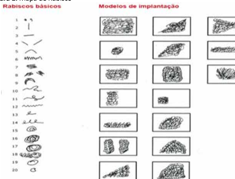
Figura 1: Mapa de Rabisco