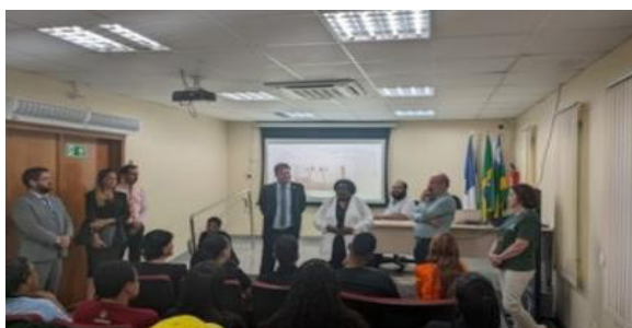
Figura 2. Cine Clube Maga e Vara do trabalho, IFTO/Dianópolis – Conversa sobre identidade

Por fim, buscando evidenciar a uma educação de qualidade, e a oportunidade de poder cursar nível superior, todos foram conhecer internamente a Sede Administrativa da UNITINS. Foram conduzidos pelos colaboradores e visitaram todas as dependências. Com intenção de promover estímulo para continuação de estudos divulgando o acesso a Universidade pública, que se acredita pode ser o caminho para transformação da vida social de cada um deles bem como de seus pares. Antes do retorno foi servido o lanche.