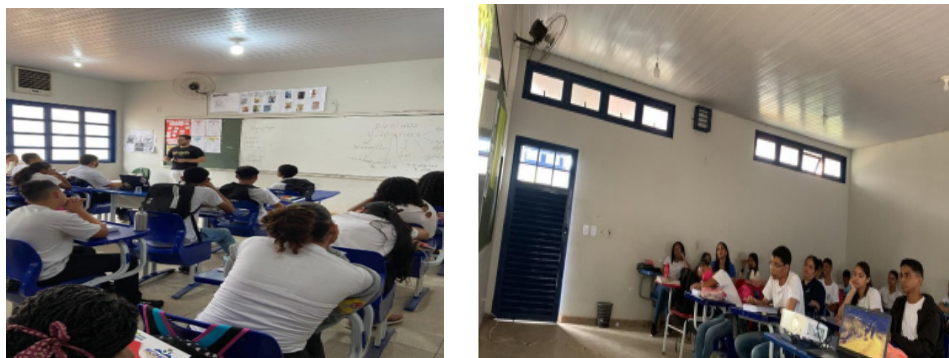
Figura 1. Exposições na primeira sessão de cinema e debate na E.C.M Maria Barros dos Reis