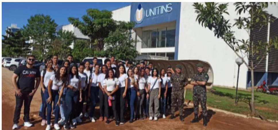
Figura 4. Visita técnica no Campus Graciosa com os alunos do 3º Ano do Ensino Médio