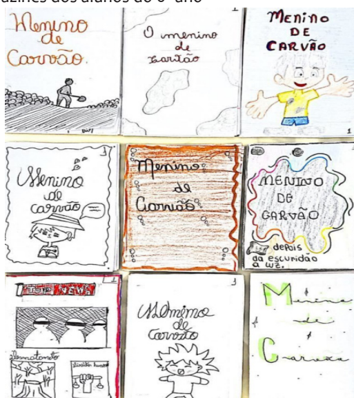
Figura 3. Capas dos Fazines dos alunos do 6º ano