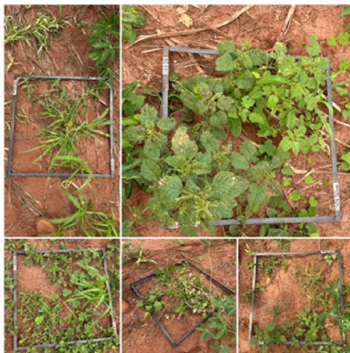
Figura 1. Levantamento fitossociológico de plantas daninhas por meio do método do quadrado inventário em área de cultivo de mandioca.

As avaliações foram realizadas mediante a aplicação do método do quadrado (0,50 x 0,50m), lançado 10 vezes aleatoriamente aos 78 dias após o plantio (DAP) da mandioca. A área de cada ponto onde se realizou a amostragem foi de 0,25 m 2 , totalizando 2,5 m 2 (Figura 1).